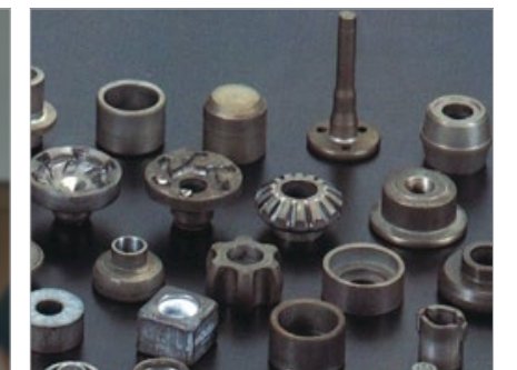
Gear, Shaft, Bearing, etc.