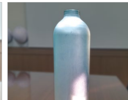
Fire Extinguisher Body