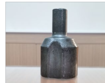
C.V Joint for Vehicles