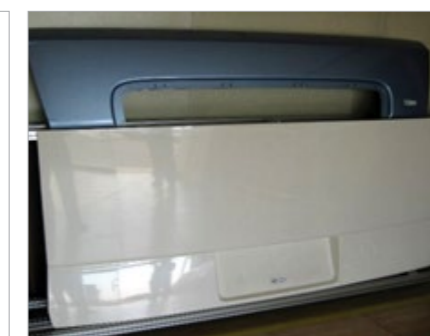
Side Panel for Vehicles