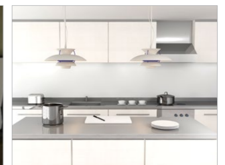
Upper Plate for Sinks