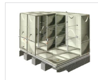
Smc Water Tank